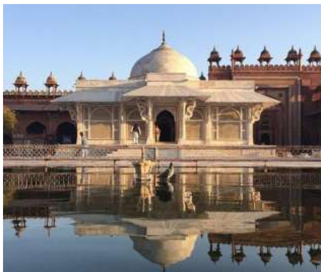
Figura 11 - Santuário do Sheikh Salim Chisti

9º. dia – 09 Nov (seg) Jaipur (C/A): Após o café da manhã faremos um passeio de jeep para conhecer o Forte Amber , declarado Patrimônio Mundial da UNESCO. No caminho pararemos para fotografar o Palácio dos Ventos (Hawa Mahal), cartão postal de Jaipur. Teremos uma experiência única em uma casa de família, com uma demonstração culinária e almoço típico. Tarde livre para passeio a pé pela cidade velha e visitar o mercado de joias Johri Bazaar . À noite teremos a oportunidade de ir a um