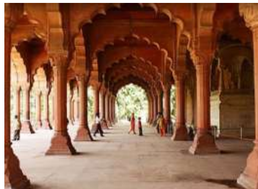
Figura 6 - Área interna do Forte Vermelho

*Rickshaw = carrinho de duas ou três rodas conduzido por um motorista