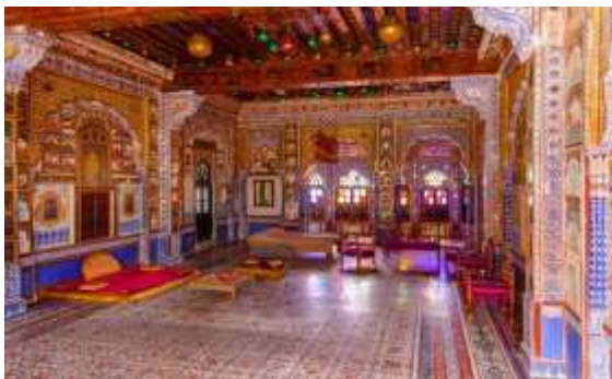
Figura 17 - Moti Mahal (Palácio das Pérolas)

12º. dia – 12 Nov (qui) Jhodpur (C/A/J): Após café da manhã, prepare-se para se maravilhar com Mehrangarh , uma fortaleza imponente erguida no topo de um penhasco rochoso, com suas muralhas escarpadas, ameias imponentes e terraços intrincadamente esculpidos que revelam séculos de história. Visitaremos o Moti Mahal (Palácio das Pérolas), com seu teto embelezado com espelhos, ouro e conchas trituradas, exibe a extravagância em sua máxima expressão. A influência mongol é vista no Sheesh Mahal (Salão dos Espelhos), onde uma miríade de espelhos adorna as paredes e o teto. À tarde desceremos até a cidade para uma pausa em Jaswant Thada , um cenotáfio de mármore brilhante em homenagem aos antigos governantes de Jodhpur. Jantar no Ajit Bhawan Palace .