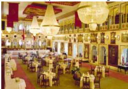
Figura 23 - Crystal Gallery (Galeria de Cristal)

16º dia – 16 Nov (seg) Udaipur (C/A/J): Manhã passeio pela cidade para visitarmos o Palácio de Udaipur , às margens do Lago Pichola. No palácio conheceremos a grande coleção de pinturas e porcelanas, o Museu Folclórico e o Jardim das Donzelas. Em seguida, visita ao Jardim Saheliyon-ki-Bari e ao Crystal Gallery no Fateh Prakash Palace . Visitaremos também o Templo Jagdish , dedicado ao Deus Vishnu. Após o almoço faremos um passeio de barco pelo Lago Pichola para apreciar a beleza da cidade. À noite, para coroar a viagem, teremos um jantar típico em uma família indiana.