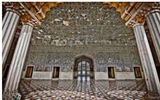
Figura 18 - Sheesh Mahal (Salão dos Espelhos)