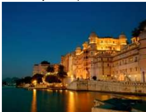
Figura 24 – Lago Pichola