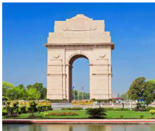
Figura 2 - India Gate

4º dia – 04 Nov (qua) Delhi (C/A): O dia será dedicado aos seguintes pontos turísticos da capital; o Museu de Gandhi , que conta toda a história do mais ilustre líder da Índia moderna. O Templo Bangla Sahib Gurudwara , maior templo sikh de Delhi, o Templo Laxmi Narayan , também chamado de Birla Mandir , um dos templos mais famosos de Delhi, onde conheceremos um pouco do hinduísmo e seus vários deuses e Qutub Minar ou Torre da Vitória , minarete de tijolo mais alto do mundo e um importante exemplo de arquitetura indo-islâmica. Retorno ao hotel. Noite livre.