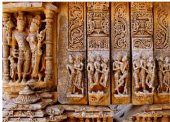
Figura 26 - Sahasra Bahu (Nagda)

18º dia – 18 Nov (qua) Delhi (C): Dia livre para compras e atividades independentes. Ônibus e guia à disposição do grupo. Fim da noite, traslado ao Aeroporto de Delhi.