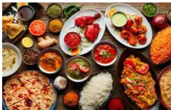
Figura 20 – Culinária Indiana

13º. dia – 13 Nov (sex) Jhodpur /Pushkar (C/A): Check out do hotel, sairemos por via terrestre para Pushkar , situado no lago de mesmo nome, é o lugar ideal para explorar e desfrutar do charme rústico do Rajastão, está cercado por colinas em três lados e dunas no outro. É a única cidade da Índia onde encontramos um templo do Deus Brahma, o criador do Universo. Tarde livre para atividades independentes.