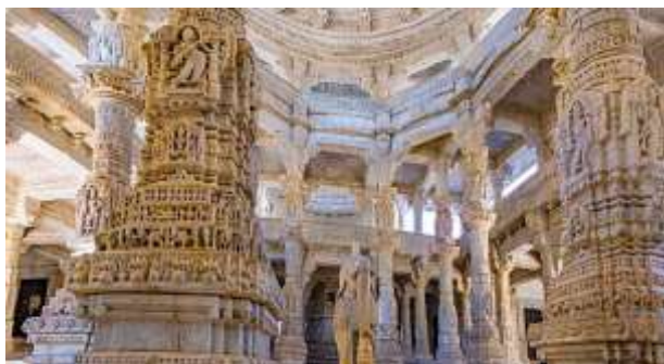
Figura 21 - Área interna Templo Jainista Ranakpur

15º dia – 15 Nov (dom) Pushkar /Ranakpur/ Udaipur (C/A): Após o café da manhã, viagem para Udaipur . No caminho visitaremos Ranakpur , magnífico complexo de templos jainistas, construído no século XIV em mármore branco, com 1.444 colunas, todas diferentes umas das outras. No final do dia chegaremos a Udaipur, cidade conhecida como a Veneza do Oriente, considerada a cidade mais romântica da Índia, com seus lagos, jardins, templos e palácios: um oásis no deserto de Thar. Noite livre.