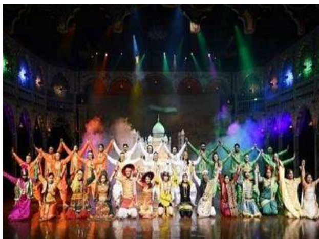
Figura 9 - Espetáculo Mohabbat-the-Taj

8º. dia – 08 Nov (dom) Agra/Fatehpur Sikri/Jaipur (C/A): Após o café da manhã, sairemos para Jaipur , a primeira cidade planejada da Índia e está localizada nas terras semidesérticas do estado do Rajastão . No caminho pararemos para conhecer a bela e deserta cidade medieval, Fatehpur Sikri , que foi capital do império durante alguns anos do reinado de Akbar, o Grande. O complexo consiste em edifícios religiosos, residenciais e administrativos. A Mesquita é considerada uma cópia da Mesquita de Meca e é extremamente elegante, contendo elementos de design hindu e persa. Também se encontra o Santuário do Sheikh Salim Chisti , um dos maiores santos sufis do mundo muçulmano. Noite livre.