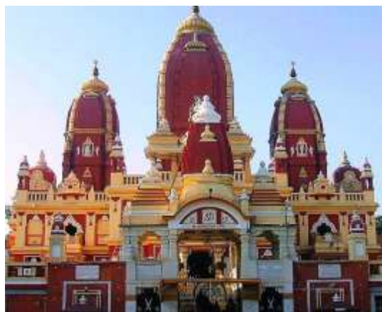
Figura 3 - Templo Laxmi Narayan

4º dia – 04 Nov (qua) Delhi (C/A): O dia será dedicado aos seguintes pontos turísticos da capital; o Museu de Gandhi , que conta toda a história do mais ilustre líder da Índia moderna. O Templo Bangla Sahib Gurudwara , maior templo sikh de Delhi, o Templo Laxmi Narayan , também chamado de Birla Mandir , um dos templos mais famosos de Delhi, onde conheceremos um pouco do hinduísmo e seus vários deuses e Qutub Minar ou Torre da Vitória , minarete de tijolo mais alto do mundo e um importante exemplo de arquitetura indo-islâmica. Retorno ao hotel. Noite livre.