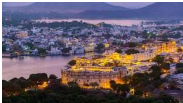
Figura 22 - Udaipur

16º dia – 16 Nov (seg) Udaipur (C/A/J): Manhã passeio pela cidade para visitarmos o Palácio de Udaipur , às margens do Lago Pichola. No palácio conheceremos a grande coleção de pinturas e porcelanas, o Museu Folclórico e o Jardim das Donzelas. Em seguida, visita ao Jardim Saheliyon-ki-Bari e ao Crystal Gallery no Fateh Prakash Palace . Visitaremos também o Templo Jagdish , dedicado ao Deus Vishnu. Após o almoço faremos um passeio de barco pelo Lago Pichola para apreciar a beleza da cidade. À noite, para coroar a viagem, teremos um jantar típico em uma família indiana.