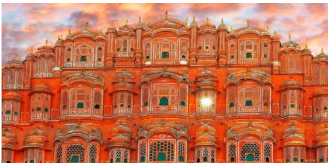
Figura 1 SEQ Figura \* ARABIC 2 - Hawa Mahal (Palácio dos Ventos)

10º. dia – 10 Nov (ter) Jaipur (C/A/L): Após o café da manhã visitaremos o Jantar Mantar , observatório astronômico construído pelo Marajá Jai Singh no século XVIII e o Palácio da Cidade , antiga residência real dos marajás e agora transformado em museu, incluindo o Salão Azul , com terraço e quarto de desenhos do Marajá. Incluímos uma visita exclusiva na área privativa do Palácio (Chandra Mahal ou Palácio da Lua), onde ainda reside o Marajá de Jaipur. Uma experiência única e inesquecível. Noite livre.