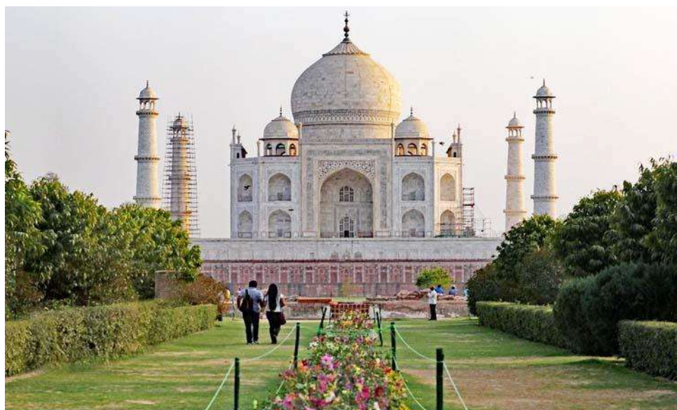
Figura 7 - Mehtab Bagh (Jardim da Luz da Lua)

6º. dia – 06 Nov (sex) Dehli/Agra (C): Check-out e saída com destino à Agra, a cidade do Taj Mahal, uma das sete maravilhas do mundo. Almoço no hotel (não incluído), à tarde visitaremos o túmulo de Itmad-ud- Daulah , um mausoléu mongol, construído entre 1622 e 1628 inteiramente de mármore branco. Em seguida iremos à Mehtab Bagh (Jardim da Luz da Lua) do outro lado do Rio Yamuna do Taj Mahal, oferece uma perspectiva deslumbrante do monumento mais amado de Agra. Noite livre.