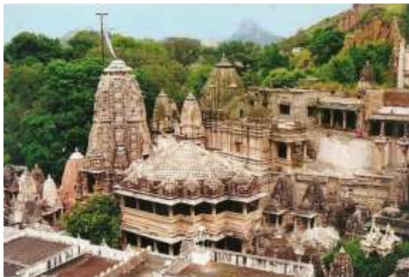
Figura 25 - Shri Eklingji Mandir

17º dia – 17 Nov (ter) Udaipur/Delhi (C/A): Após o café da manhã, visita aos templos Shri Eklingji Mandir , esculpido em arenito e mármore e dedicado ao Deus Shiva, uma maravilha arquitetônica e Sahasra Bahu (Nagda) , templo datado do século X. À tarde, traslado ao aeroporto para embarque no voo com destino à Delhi. Chegada e acomodação no hotel.