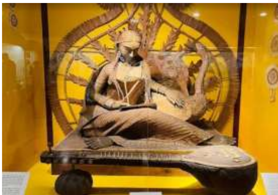
Figura 5 - Museu Nacional

da Índia. Abriga uma variedade de artigos que vão desde a era pré-histórica até obras de arte modernas. O museu compreende as áreas de Arqueologia, Antropologia, Armas e Armaduras, Antiguidades Asiáticas, Arte, Joias e outros. À tarde, visita a Velha Delhi , onde faremos um passeio de rickshaw * para desvendar os segredos da vida e do mercado local. Além disso, visitaremos a Jama Masjid , grande mesquita da Velha Delhi e a maior da Índia, o Forte Vermelho , elegante cidadela do quinto imperador mongol. Noite livre