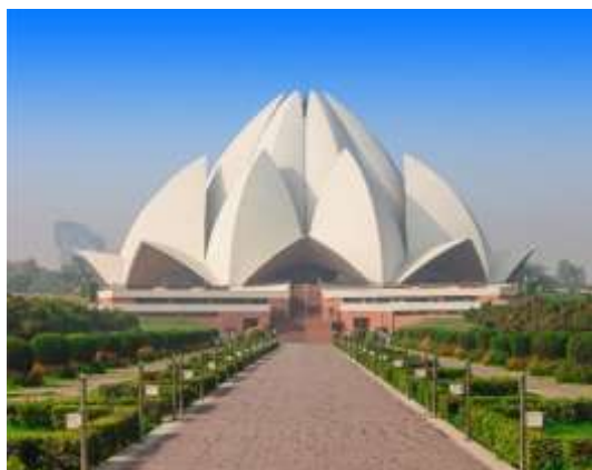
Figura 1 - Templo Lotus

3º dia – 03 Nov (ter) Delhi (C/J): Chegada e assistência no aeroporto e traslado para hotel. Manhã livre para descanso. À tarde um tour pela vibrante Delhi, uma das cidades mais antigas do mundo para conhecermos alguns pontos turísticos como o Templo de Lótus , da Fé Bah'ái, construído em 1986, ganhou inúmeros prêmios de arquitetura e serve como um templo-mãe no subcontinente indiano, o India Gate , com 42 metros de altura, um arco semelhante ao "Arco do Triunfo", no meio de um cruzamento, prédios governamentais e residências oficiais, que lembram a arquitetura colonial britânica. Passaremos por alguns prédios do governo como a Casa do Parlamento e o Rashtrapati Bhawan , residência oficial do Presidente da Índia. Jantar no luxuoso Leela Palace Hotel .