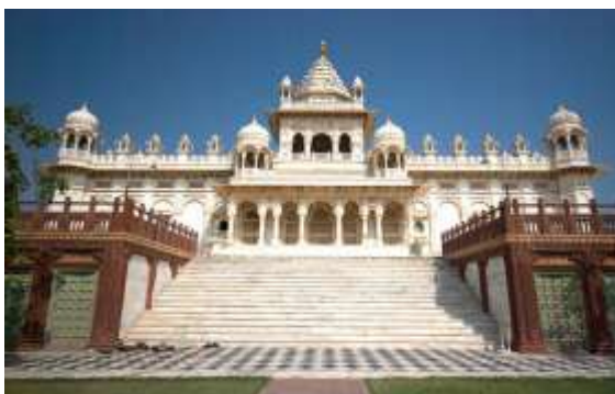
Figura 19 - Jaswant Thada