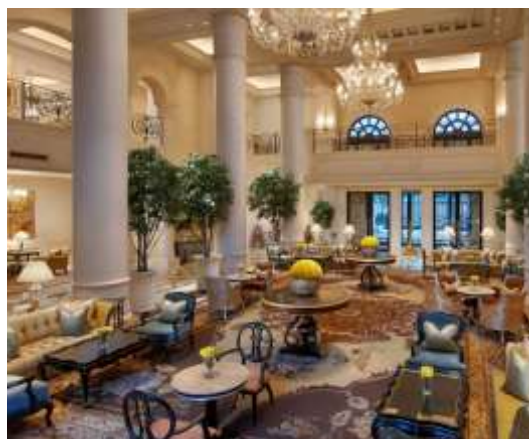
Figura 4 - Leela Palace Hotel

5º. dia – 05 Nov (qui) Delhi (C/A): Saída para visitarmos o Museu Nacional , um dos maiores museus