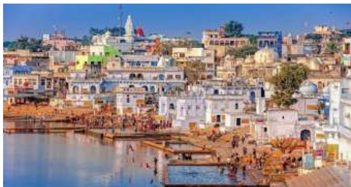
Figura 27 - Lago Sagrado de Pushkar

14º. dia – 14 Nov (sáb) Pushkar (C/A): Após o café da manhã, visitaremos o Templo Jagatpita Brahma Mandir , o único templo existente dedicado ao Deus Brahma e foi construído no século XIV, erguendo-se em um pedestal alto com degraus de mármore que levam até ele e o Lago Sagrado de Pushkar , considerado o local mais sagrado da cidade de Pushkar. Tarde livre para atividades independentes.