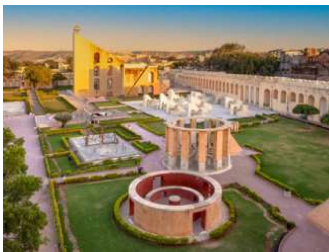
Figura 13 - Jantar Mantar

10º. dia – 10 Nov (ter) Jaipur (C/A/L): Após o café da manhã visitaremos o Jantar Mantar , observatório astronômico construído pelo Marajá Jai Singh no século XVIII e o Palácio da Cidade , antiga residência real dos marajás e agora transformado em museu, incluindo o Salão Azul , com terraço e quarto de desenhos do Marajá. Incluímos uma visita exclusiva na área privativa do Palácio (Chandra Mahal ou Palácio da Lua), onde ainda reside o Marajá de Jaipur. Uma experiência única e inesquecível. Noite livre.