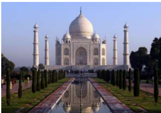
Figura 8 - Taj Mahal

residência dos imperadores da dinastia Mughal até 1638, antes da capital ser transferida de Agra para Delhi. À noite, desfrute do espetáculo “Mohabbat-the-Taj” . É uma série de peças que retratam a saga do amor. O verdadeiro e imortal amor do Imperador Shah Jahan pela sua bela esposa Mumtaz Mahal.