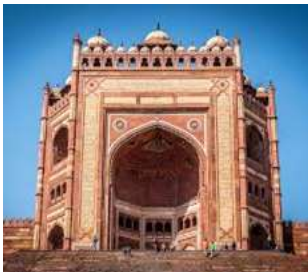
Figura SEQ Figura \* ARABIC 10 - Fatehpur Sikri

8º. dia – 08 Nov (dom) Agra/Fatehpur Sikri/Jaipur (C/A): Após o café da manhã, sairemos para Jaipur , a primeira cidade planejada da Índia e está localizada nas terras semidesérticas do estado do Rajastão . No caminho pararemos para conhecer a bela e deserta cidade medieval, Fatehpur Sikri , que foi capital do império durante alguns anos do reinado de Akbar, o Grande. O complexo consiste em edifícios religiosos, residenciais e administrativos. A Mesquita é considerada uma cópia da Mesquita de Meca e é extremamente elegante, contendo elementos de design hindu e persa. Também se encontra o Santuário do Sheikh Salim Chisti , um dos maiores santos sufis do mundo muçulmano. Noite livre.