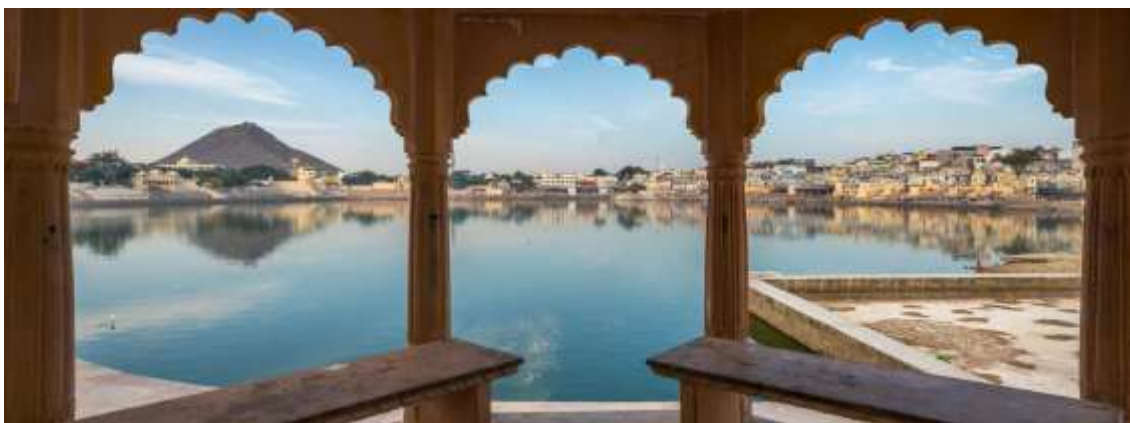
Figura 15 - Pushkar

13º. dia – 13 Nov (sex) Jhodpur /Pushkar (C/A): Check out do hotel, sairemos por via terrestre para Pushkar , situado no lago de mesmo nome, é o lugar ideal para explorar e desfrutar do charme rústico do Rajastão, está cercado por colinas em três lados e dunas no outro. É a única cidade da Índia onde encontramos um templo do Deus Brahma, o criador do Universo. Tarde livre para atividades independentes.