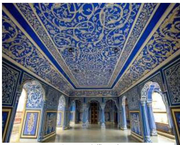
Figura 14 - Salão Azul

11º. dia – 11 Nov (qua) Jaipur/Jhodpur (C): Saída com destino a Jodhpur, popularmente chamada de "Cidade Azul" devido aos distintos edifícios azuis que ladeiam suas ruas estreitas e vielas sinuosas. Após check-in hotel um passeio a pé e de riquixá especial pela Cidade Velha, visita ao renomado Sadar Bazaar situado no coração de seu núcleo histórico, a antiga cidade murada, um paraíso para as compras. Noite livre